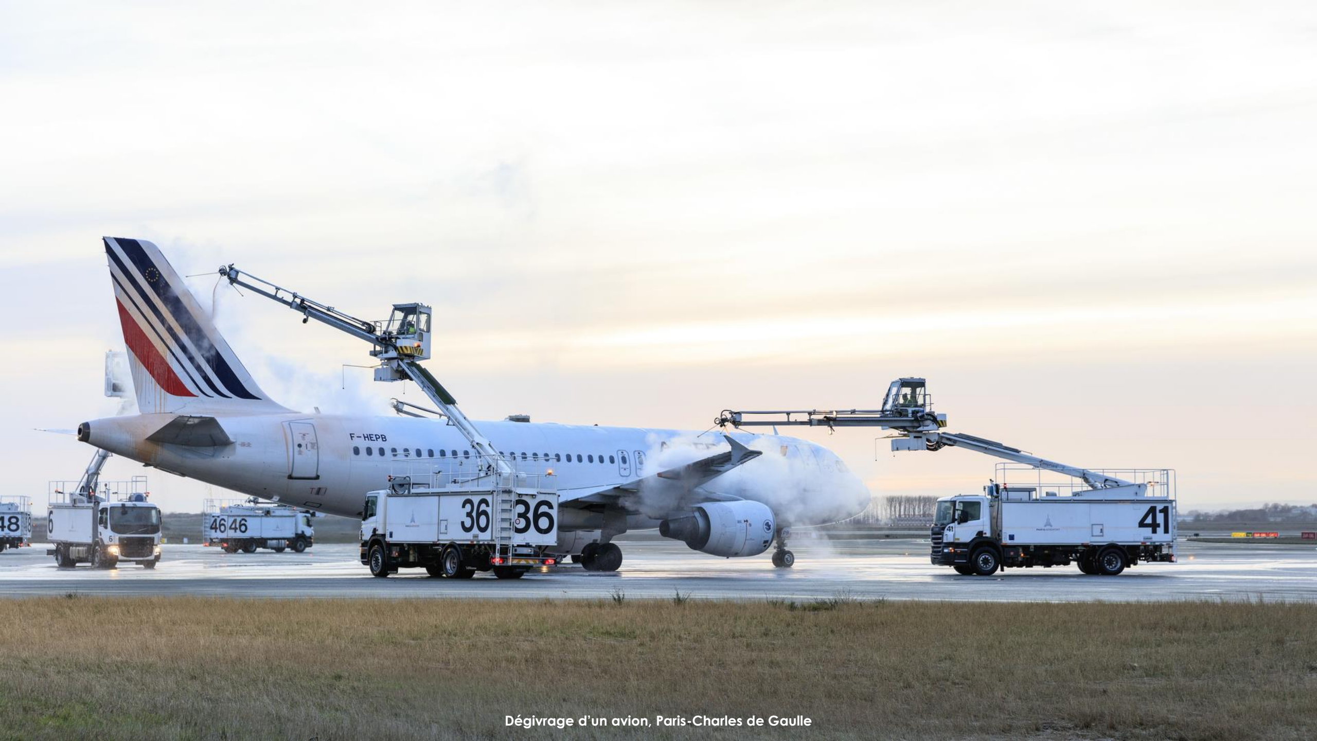
Dégivrage d'un avion, Paris-Charles de Gaulle