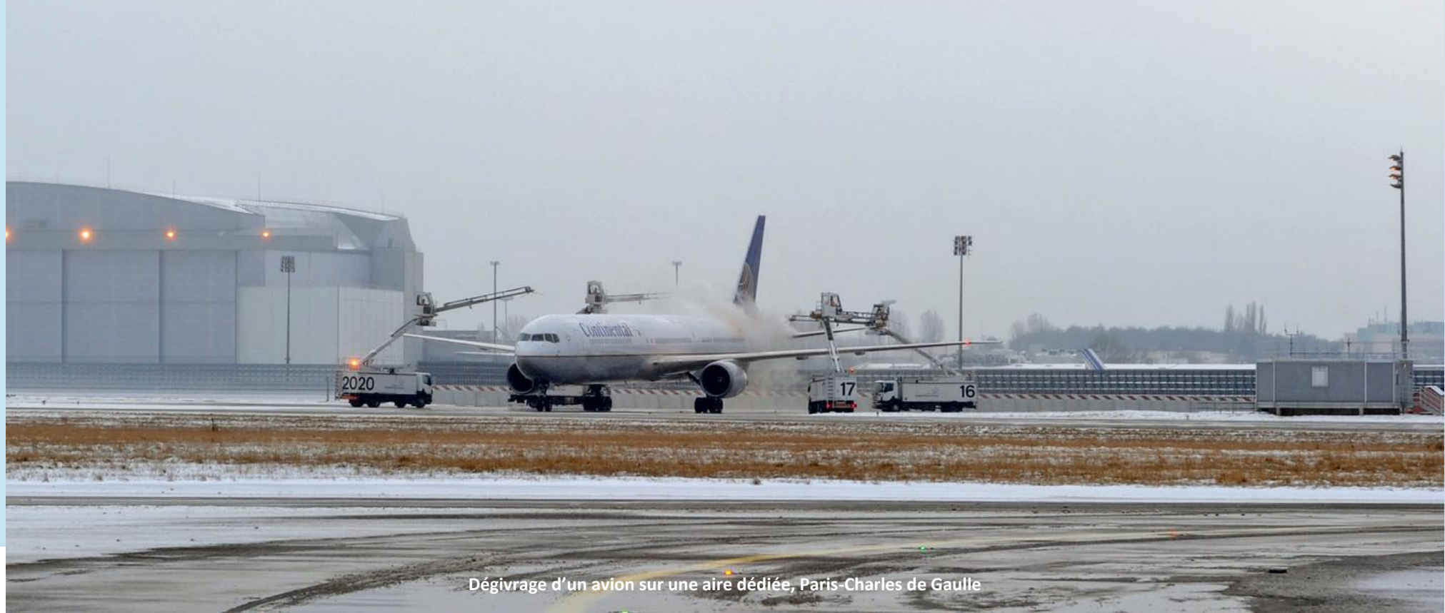
Dégivrage d'un avion sur une aire dédiée, Paris-Charles de Gaulle