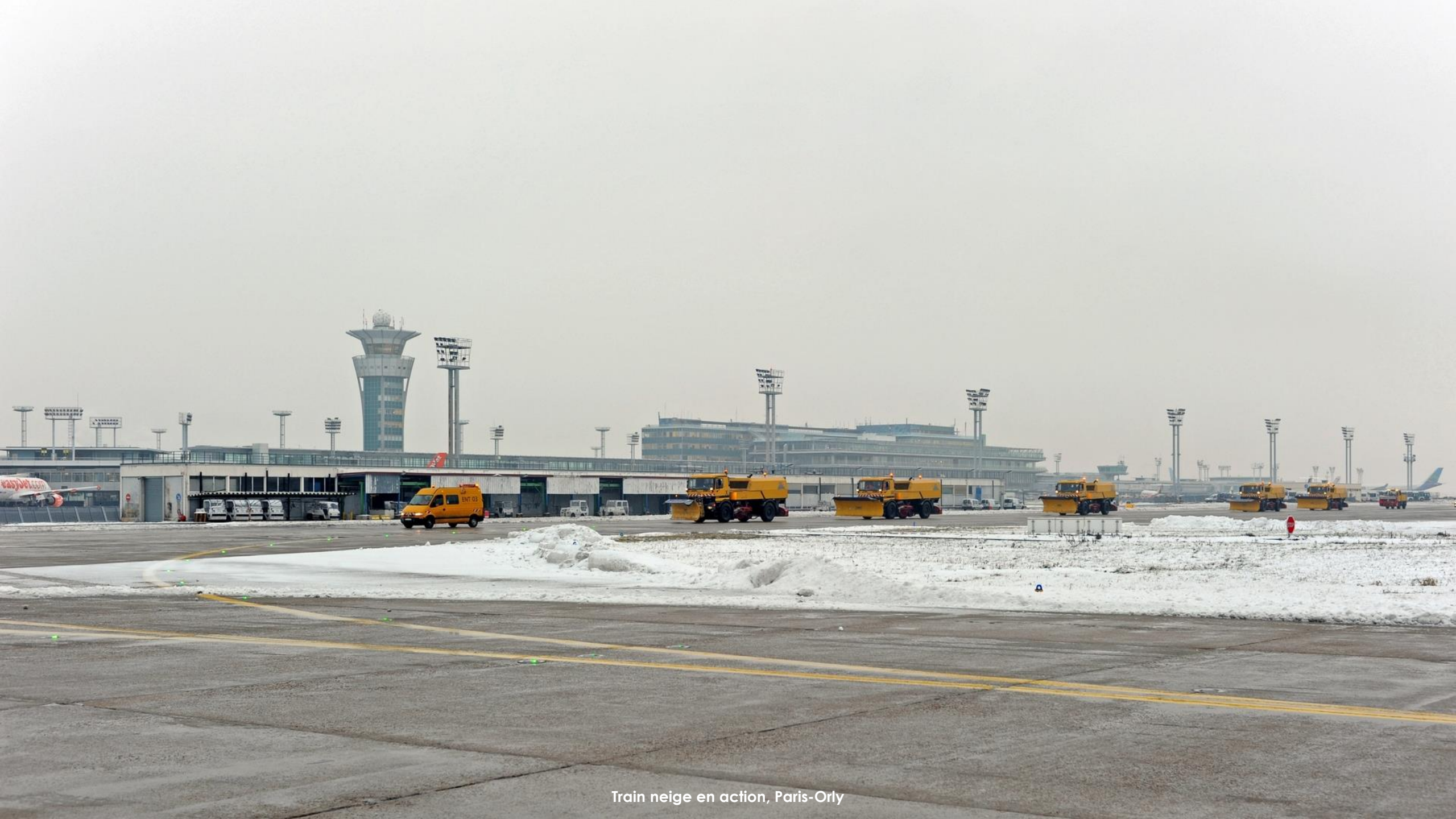
Train neige en action, Paris-Orly