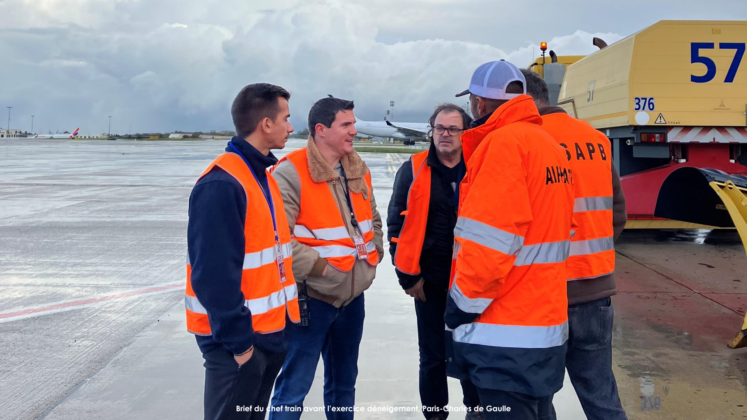
Brief du chef train avant l'exercice déneigement, Paris-Charles de Gaulle