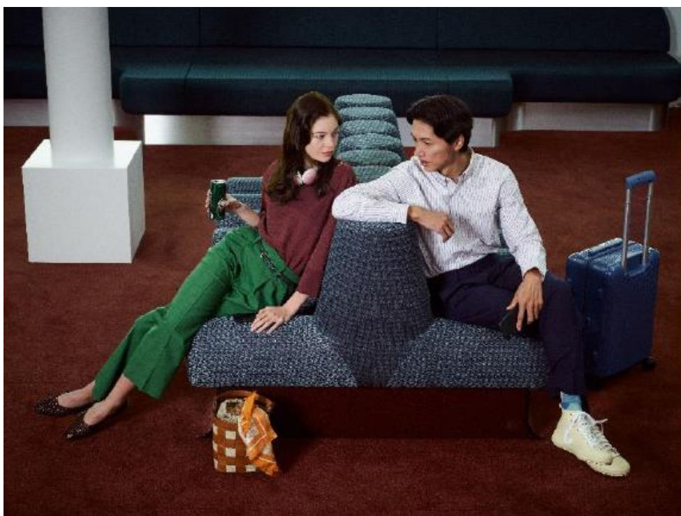
Terminal 2G - La marque Extime intervient au moment où le passager se reconnecte au voyage à venir

Au sein du Terminal 2G, Extime, invité par Paris Aéroport propose une expérience parisienne unique, offrant ainsi l'emprunte locale aux voyageurs du monde entier.