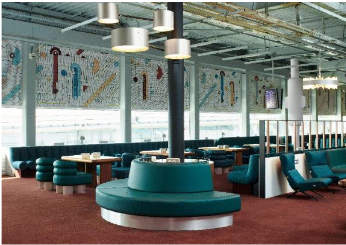
Terminal 2G à Roissy - La nouvelle salle d'embarquement du terminal 2G s'inscrit désormais dans la pure tradition du mobilier français et des arts décoratifs