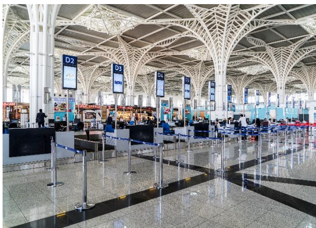
Aéroport Prince Mohammad Bin Abdulaziz - Médine.