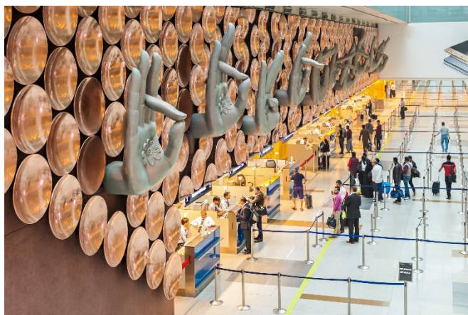
Aéroport Indira Gandhi – Delhi.